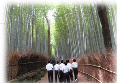
京都嵐山の竹林 (修学旅行の写真より)

竹のように 竹中 郁 のびろ のびろ まっすぐ のびろ こどもたちよ 竹のように のびろ 風をうけて さらさらと鳴れよ 日をうけて きらきらと光れよ 雨をうけたら じつとしてろ 雪がつもれば いっそうこらえろ 石をなげつけられたら かちんとひびけ ぐんぐん 根をはれ 土の中で その手とその手を がんじがらめに握りあえ 竹 竹 竹のように のびろ 五月のみどりよ もえあがれ